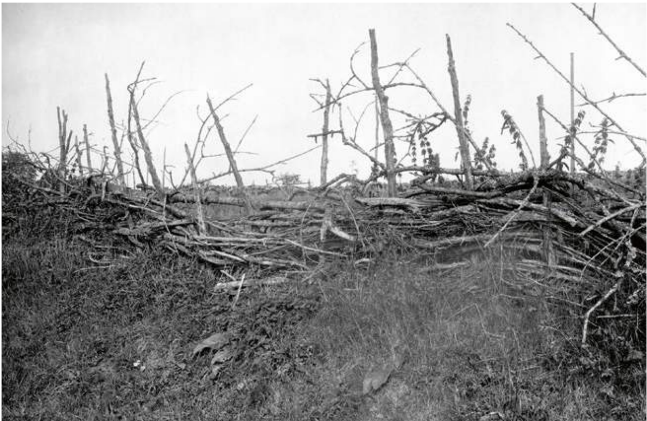
"... en flätad gårdesgård i Näflinge by. Gården är af förenkadt utförande. Stafvarne bestå af diverse löfträdsgrenar. Flätmaterial af såväl löfträdsgrenar som enris. På den ena bilden löper hågnaden öfver gammal, numera öfvergifven odlingsmark tillhörig byn." 1925. Text och foto: Märten Sjöbäck, Helsingborgs museums samlingsdatabas Carlotta (PD).