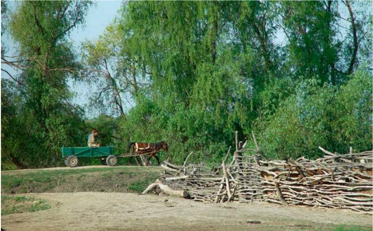
”Slarvig” flätgärdesgård byggd med grova grenar. Donaudeltat, maj 2003.