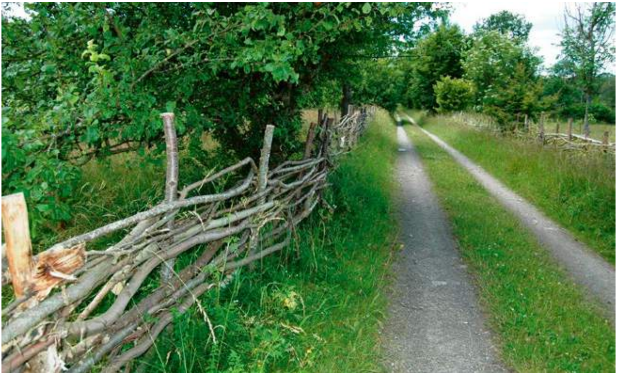
Flätgärdesgård av kvistad löv. Här har så kallad surskog använts till stakar och flättningsmaterial. Hörjelgården 2015.