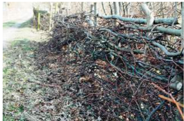
Flätgärdesgård av okvistad löv på Hörjelgården 2016 utefter uppfartsvägen till byggnaderna.

Gärdesgårdar som uppförs enbart av ris från lövträd har mycket kortare livslängd än gärdesgårdar där störrarna är gjorda av en. Om man har brist på en så kan ek vara ett alternativ som material till störrarna, särskilt om den sveds. Gärdesgården kan få ytterligare stöd om man planterar buskar eller träd längs den. Livslängden på gärdesgårdar av löv kan förlängas om de hålls fri från uppväxande vegetation.