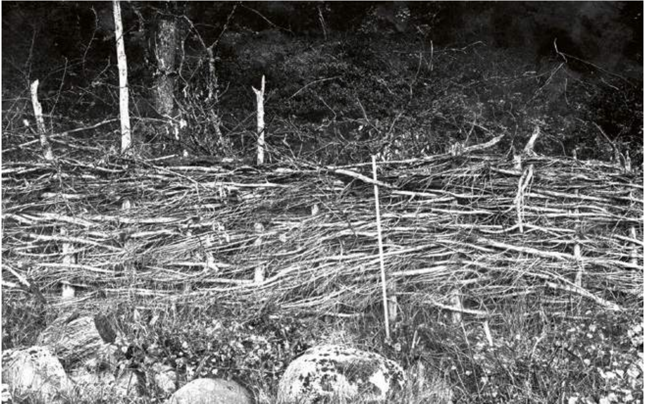
Flätgädesgård av okvistat enris. Notera meterkåppen i bildens mitt. Råröd, Riseberga socken, Norra Åsbo härad, 1924.