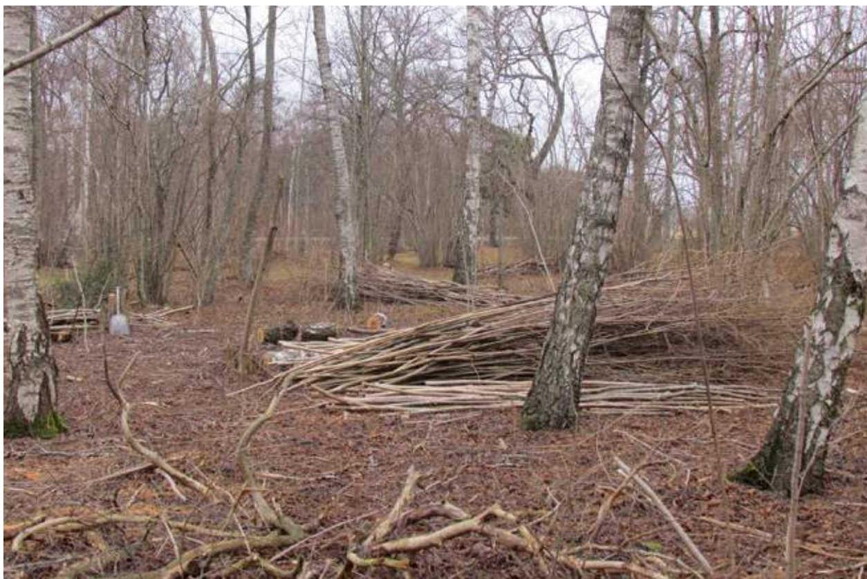
Långa raka hasselgrenar som sorterats ut i samband med en röjning för att användas i flätgärdesgårdar. Väskinde, Gotland, 2016.

Stavar av en, Juniperus , alla jämnt och likformigt avskurna i brösthöjd, nedslagna i jorden 30–40 centimeter djupt med ett inbördes avstånd av överallt i det närmaste 50 centimeter. Flätning tät och fast ut och in mellan stavarna av avkvistade, långsmala stammar och grenar av en, c:a tre meter långa med en diameter i tjockändan av 2–3 centimeter. De översta i flätningen ingående enespöna äro längre och grövre, ända till fyra meter långa med en diameter i tjockändan av ända till 4 centimeter samt snodda samman inbördes och kring stavarna som rep. Hela flätningens höjd 120 centimeter. Stödstavar av en fastgjorda i allmänhet vid var fjärde eller femte stav.