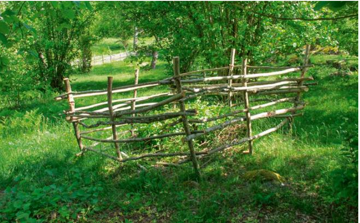
Enkel flätad konstruktion för att skydda uppväxande hasselbuskar i en före detta ängsmark som numera betas. Föllingsö, Östergötland.