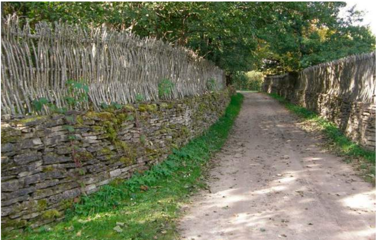
Vertikal flätgärdesgård på stenmur i Estland, 2008.