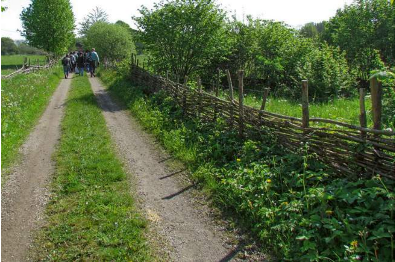
Flätgärdesgårdar av kvistad löv vid uppfarten till Hörjelgården 2014. Foto: Fabian Mebus/RAÄ.