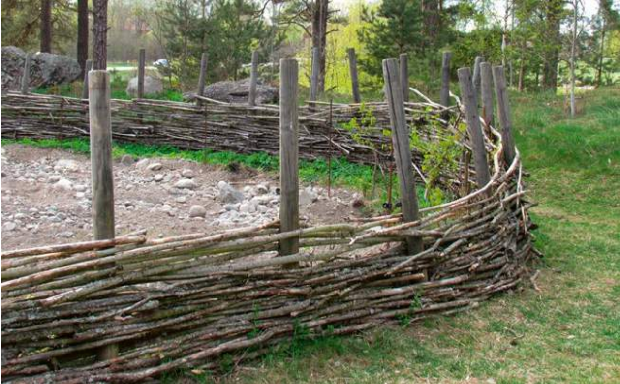
Flätgärdesgård kring grishage på Vallby friluftsmuseum i Västerås, 2014. På insidan av gärdesgården finns en eltråd.