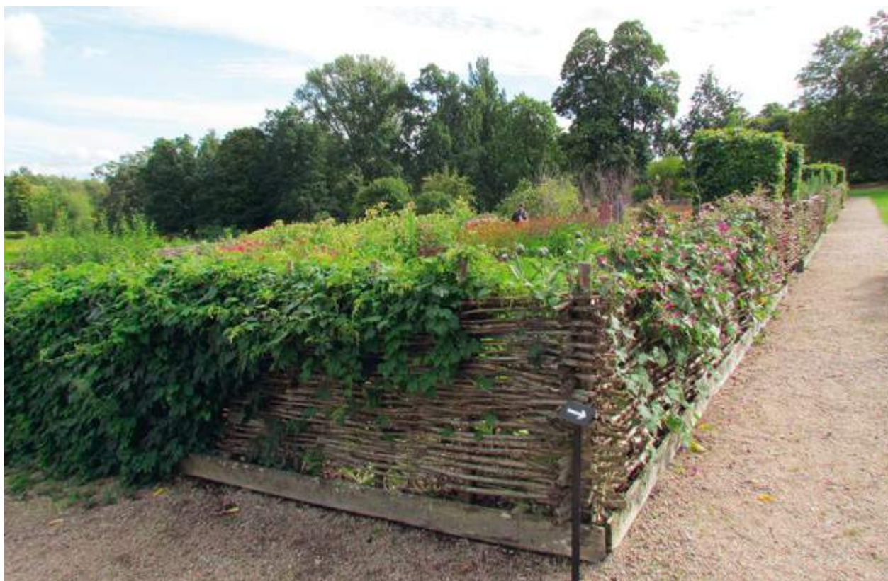
Flätgärdesgård kring trädgårdsodlingar i kulturresevatet Karlslund, Örebro, 2016.

Traditionen att bygga flätgärdesgårdar minskade under 1800-talet och upphörde i princip helt en bit in på 1900-talet. Nuförtiden hittas flätverk framför allt i trädgårds- och museimiljöer.