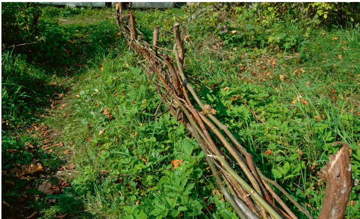
Låg flätgärdesgård av korgvide i kanten av en del av fjärlsträdgården på Hörjelgården 2016.

Relativt låga hägnader av enbart pil sägs ha varit tämligen allmänna omkring kälhagar och dylikt i vissa delar av Skåne. De kan ha använts för att utestänga gäss, ankor och höns, under förutsättning