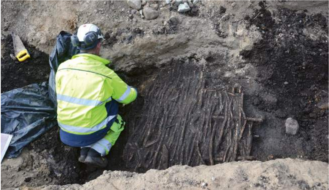
Flätad hågnad, förmodligen av hassel, som upptäckts under en utgrävning vid Stortorget i Lund 2015. Hågnaden användes troligen för att hågna in en kålodling.