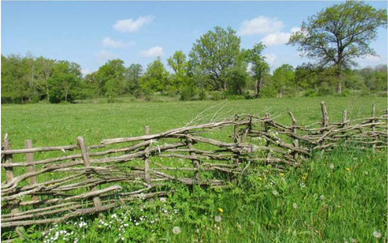
Flätgärdesgård av kvistad en, uppförd på Hörjelgården 2012. Denna horisontellt flätade gärdesgård är förmodligen den beständigaste av gårdens gärdesgårdar.