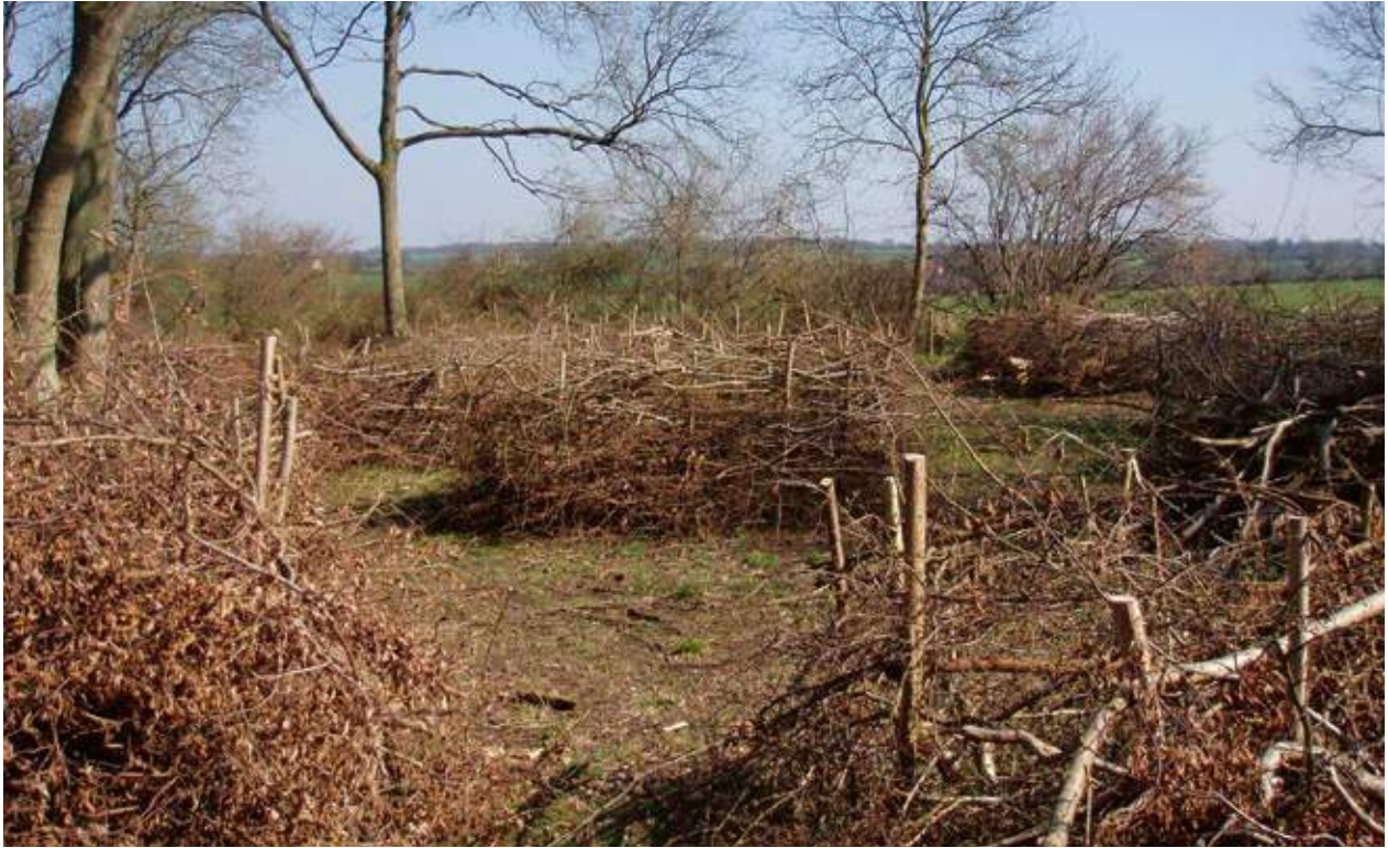
Flätade inhägnader av ris runt buskar och träd som föryngrats i samband med en större röjningsåtgärd i Hatfield Forest norr om London 2007. Marken betas och de nya skotten måste skyddas de första åren efter röjningen.