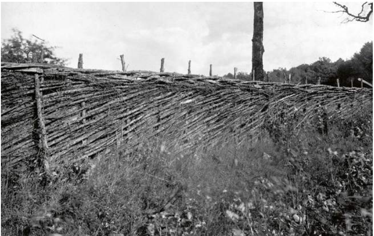
Flätgädesgård av kvistad en, flätad med svagt lutande inflätning och ett horisontellt övre plan. Sandåkra, Norra Mellby socken, 1924.