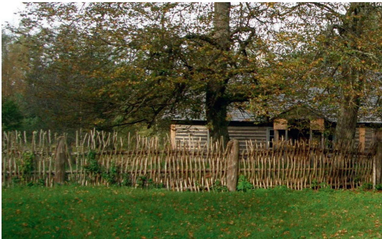
Vertikal flätgärdesgård, också kallad oppståndsgärdesgård, i Estland, 2008.

I det gamla bondesamhället fanns det behov att periodvis hägna in vissa träd och buskar. Det gällde till exempel stubbskottsträd, lågt hamlade träd eller hasselbuskar som behövde skydd från betande djur de första åren efter förnygring. Ett sätt att skydda dessa träd och buskar är att uppföra ett enkelt flätverk. Det krävs ingen särskilt avancerad konstruktion eftersom skyddet endast behöver fungera ett fåtal år. Därför kan man låta hägnaden förmultna utan att fylla på eller underhålla den.