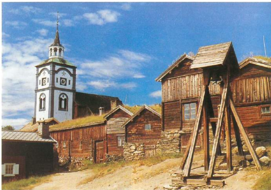
Hyttklokka og Røros-kjerke.

stort behov for trekkdyr - hester og okser. Arbeiderne fikk rydde seg grasvoller på "hagaene" omkring byen, vederlagsfritt på Kobberverkets eiendom. I praksis ble hage- ne brukerens eiendom. Grashaga- områdene hadde et karakteristisk mønster av små åkerlapper, innram- met av steingarder, vanligvis med ei høyløe midt på. Utover på 1800-tal- let utviklet det seg regulær seterdrift spesielt i området Småsetran. Folk flyttet ut fra byen og ut på setervol- lene så snart våren kom. Med foru- rensningen fra smeltehytta kan en forestille seg at dette var behagelig kanskje nesten nødvendig. Byen beskrives som "død" i sommerhalv - året, og Røros som en typisk vinter- by. Flere av setervollene fikk etter hvert bebyggelse som mer forer tan-