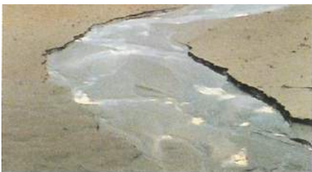
Nedre Storwartz gruve. Foruten å være viktige kulturhistoriske spor representerer gruvene et betydelig forurensningsproblem.

eiendomsmønster. Et problem her er når hus rives og vi får "huller" i en ellers tett bystruktur. For mange slike huller vil utarme den strenge urbane struktur som karakteriserer Røros' bybilde.