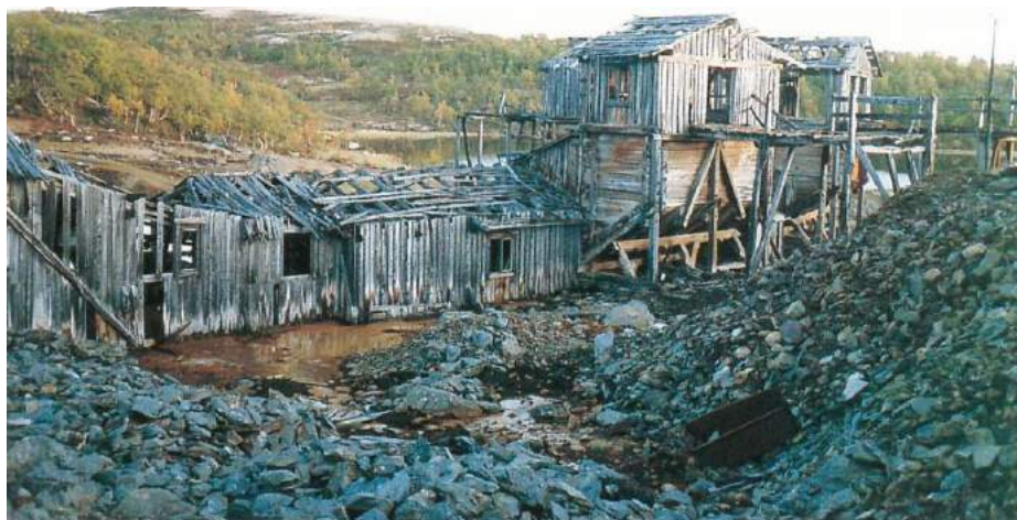
Ruin av taubanestasjon Christianus sextus gruver.

Etter hvert ble det funnet og drevet gruver mange steder, hovedsaklig samlet i to felter, Storwartzfeltet (Gamle og nye Storwartz, Olavs-