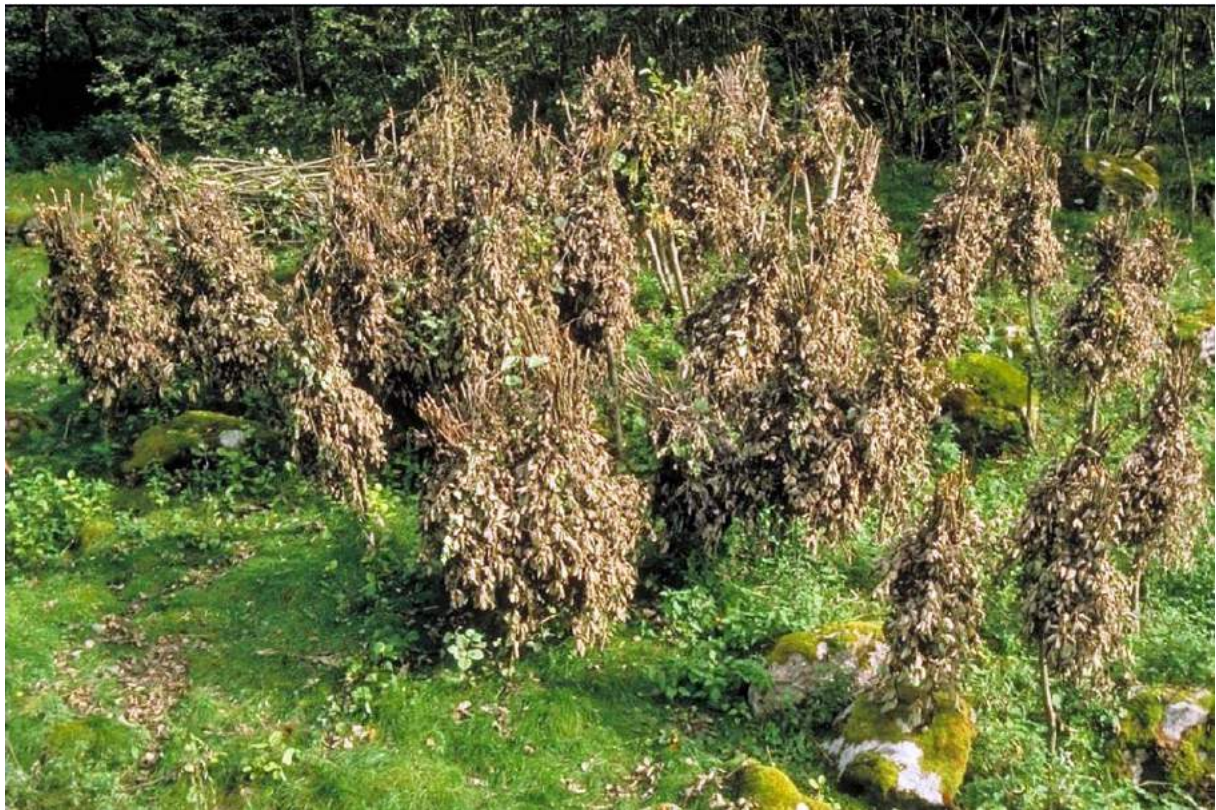
Figur 9. Nyleg lauva gråor i Lærdal, Sogn og Fjordane.

Selje og hassel har også blitt stubbehausta. For selja sin del blei det gjort mest for fôret, men virket kunne også nyttast til flettverk og anna. Hassel stubbehausta dei fyrst og fremst for å få trevirke til ulike føremål (tønneband, korgfletting, fiskestenger, staurar m.m.), samt brennved. Hassellauvet blei til dels også nytta, mellom anna til grisefôr. Nøttene kom til nytte i eige hushald og somme stader var nøtter eksportvare.