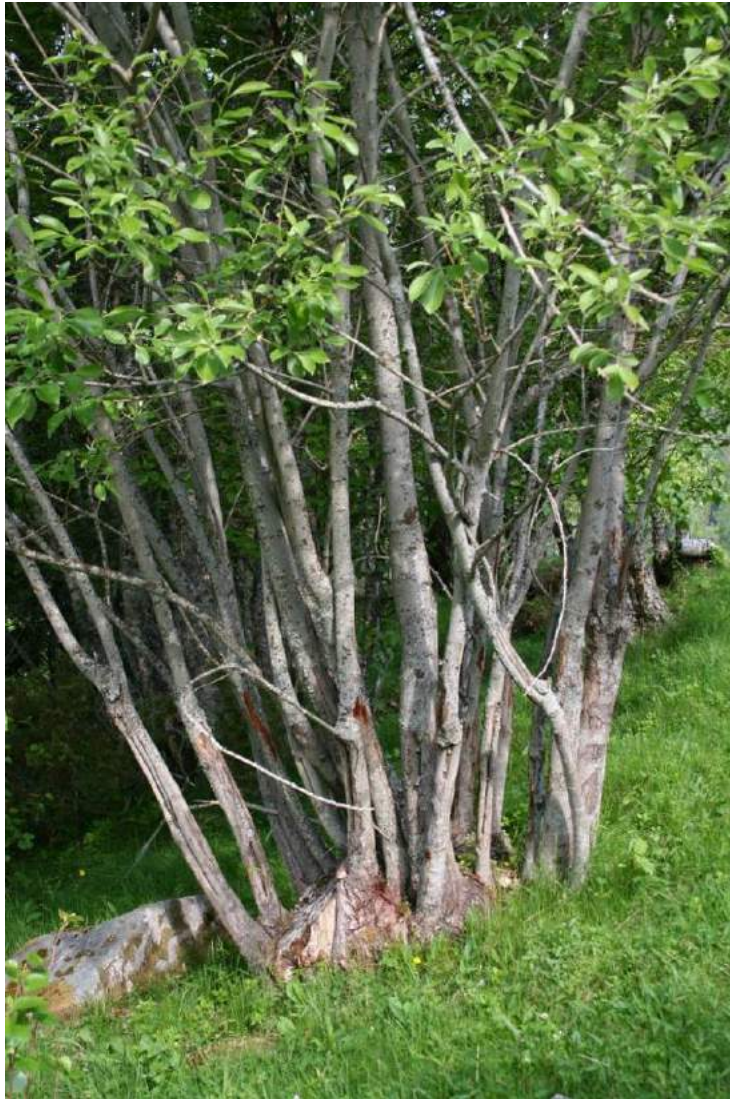
Figur 10. Stubbehausta selje i Skardvika i Hamarøy kommune i Nordland.

Ei sams nemning for denne type haustingsområde er stubbeskotskogar . Dette er ikkje ei eiga naturtype i seg sjølv, men kan akkurat som med styvingstrea finnast som innslag i ulike naturtypar innanfor kulturlandskap (t.d. haustingsskog) og skog (t.d. gråor-heggeskog, fjellbjørkeskog).