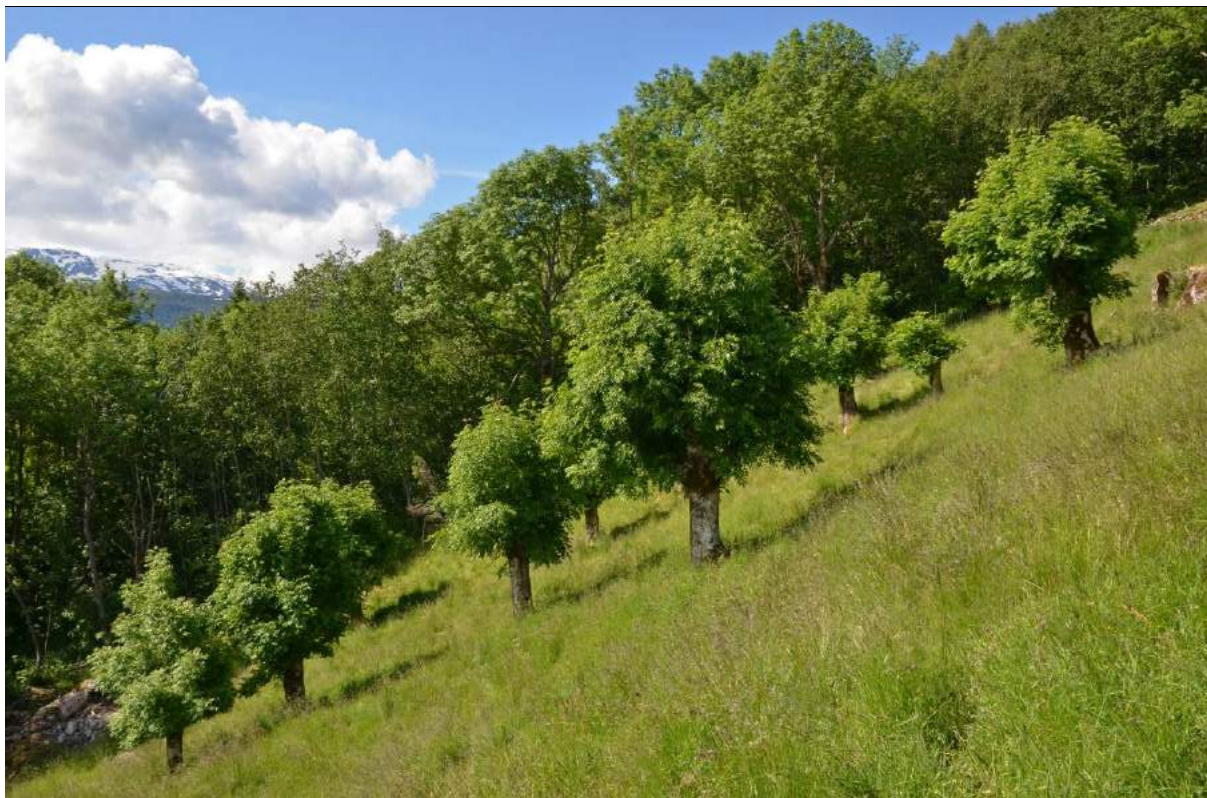
Figur 6. Lauveng, slåtteeng med styvingstre på Grinde i Leikanger kommune, Sogn og Fjordane.