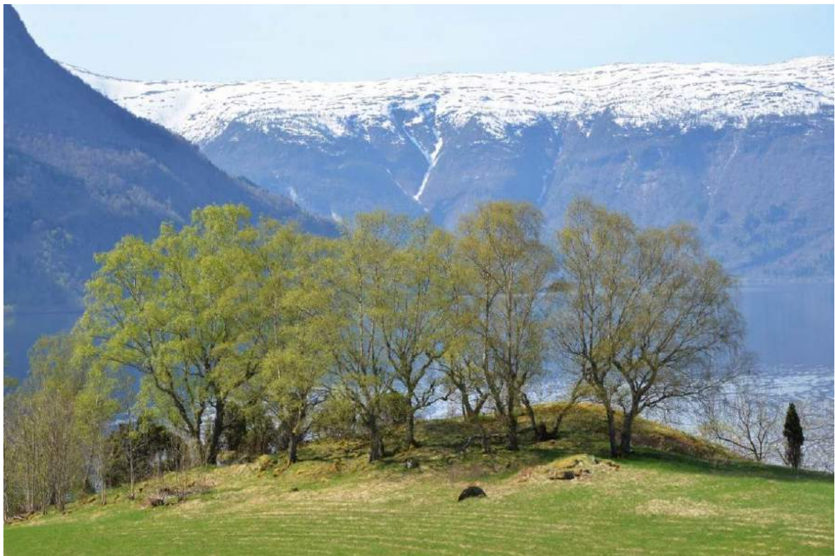
Figur 3. Hagemark med styvingstre av bjørk på Kroken, Luster kommune i Sogn og Fjordane. Styvingstre av bjørk får ei særeigen kandelaber-aktig form. Det er ei tid sidan desse trea har vore i hevd.