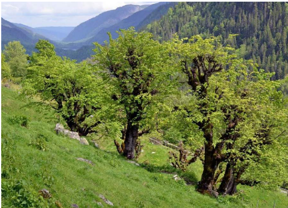
Figur 5. Hagemark med styvingstre hovudsakleg av alm på Myljom-To i Hjartdal kommune, Telemark. Dette har tidlegare vore lauveng, der ein både slo enga og lauva trea. I vår tid er bakkane berre blitt beita. Slåtten har teke slutt, men trea blir enno lauva.

Lauveng er lysopen, tresett slåttemark forma ved hausting av fôr i både feltsjiktet (slått og beiting) og tresjiktet (vanlegvis styving). Feltsjiktet har meir enn 50 % dekning. Tresjiktet består av styva eller stubbelauva gamle lauv- og edellauvtre som alm, ask og bjørk, med tettleik 2-5 gamle tre per dekar. Lauveng kan også ha innslag av hassel.