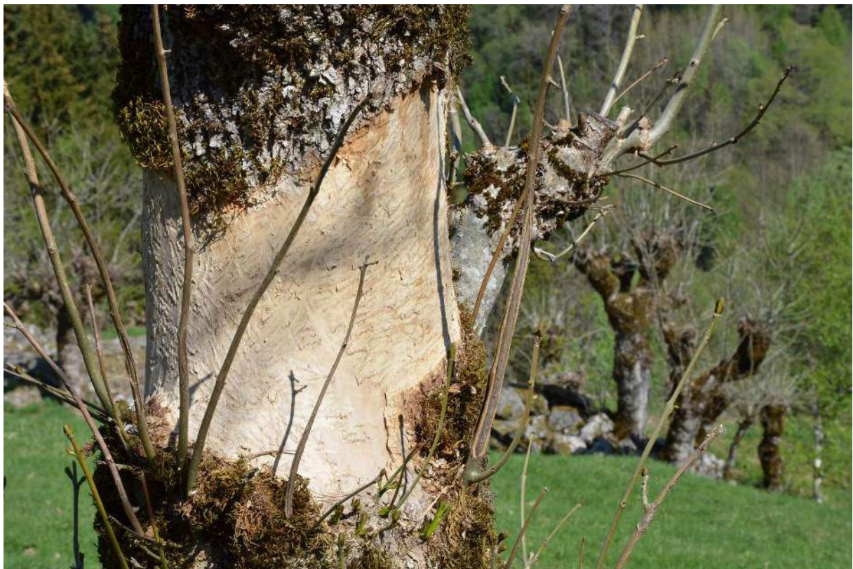
Figur 14. Hjortegnag på styvingstre. Dette treet er ringborka av hjorten og vil dø i løpet av eit par år.

Mykje haustingsskog ligg i vanskeleg og lite tilgjengeleg terreng og har såleis ikkje vore særleg utsett for oppdyrking, utbygging eller vegprosjekt. Skogbruk med treslagskifte og tilplanting av bartre, ofte framande treslag, er derimot eit sterkt trugsmål mot gamal haustingsskog. I somme område kjem framande treslag som platanlønn inn og fortrenger heimlege lauvtreslag. For alm og ask kan i tillegg soppsjukdomar bli eit alvorleg trugsmål framover. Både askeskotsjuka og almesjuka breier om seg, askeskotsjuka aller mest. Klimaendringar i retning av eit mildare klima er blant årsakene til dette.