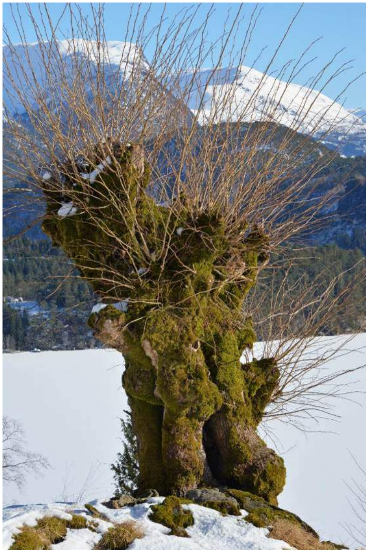
Figur 12. Eit frittstående styvingstre med rik moseflora på stamma.

Haustingsskog er per definisjon styvingstre eller stubbeskotskog på skrinn og steinrik mark. Såleis er det vanlegvis ikkje så artsrikt på bakken rundt trea. Det kan likevel finnast unnatak, til dømes på kalkrik grunn. Steinur av kalkfattig berg kan også ha rike lommer der kalk og mineral er «knust» fram.