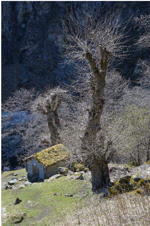
Figur 8. Alm vart forma slik at den danna fleire «etasjar» for maksimal lauv- og risproduksjon. Her ein restaurert alm med eiga lauv- og høyløe ved husmannsplassen Galdane i Lærdal kommune, Sogn og Fjordane.