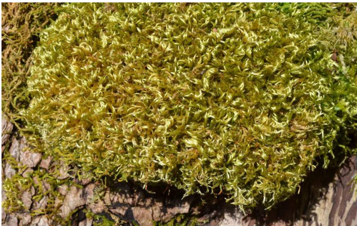
Figur 13. Krypsilkemose Homalothecium sericeum er vanleg på rikbark på game styvingstre.

Det er ikkje berre i restaureringsfasen ein vil få ein gjødseleffekt av tiltaka. Feltsjiktet må haldast i sjakk også etter at ein kjem i gang med den regelbundne skjøtselen. Haustingskogane har tradisjonelt blitt noko beita, helst av småfe (sau eller geit). Ofte er det også glidande overgangar mot hagemark og/eller lauveng. I skjøtselsfasen kan det såleis vera aktuelt både med beite og noko manuell rydding.