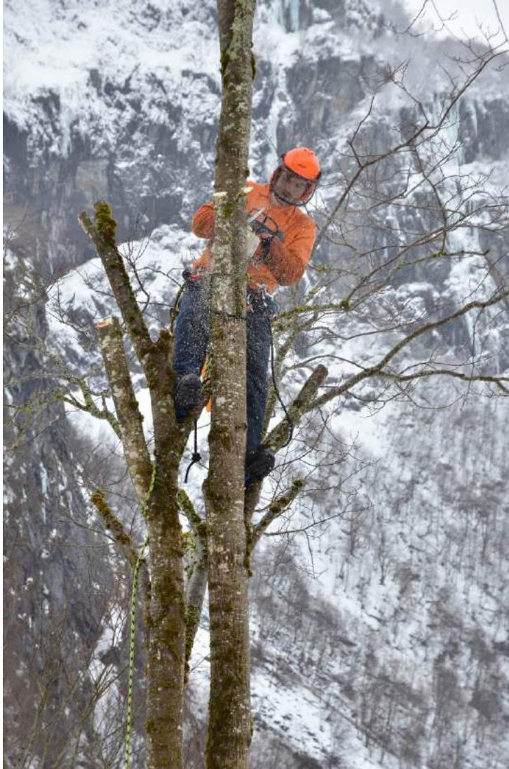
Figur 19. Trepleiar i aksjon med restaurering av eit styvingstre. Merk at han har sikra seg med klatresele og tau.