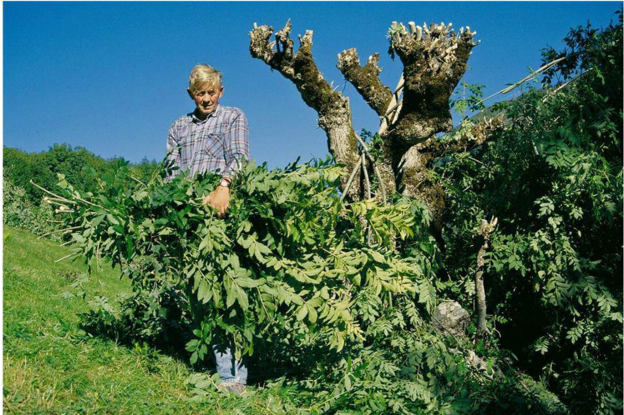
Figur 7. Lauving av ask på Grinde, Leikanger kommune. Sogn og Fjordane.