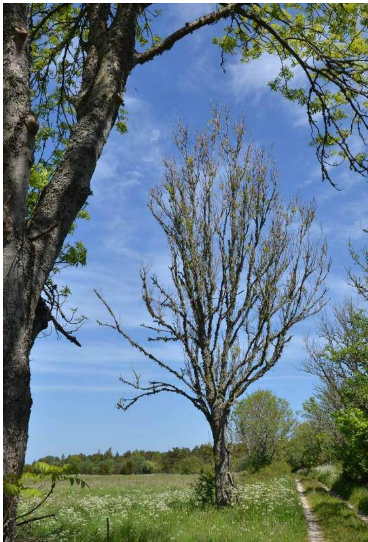
Figur 15. Ask med askeskotsjuka.

Det er med andre ord mange fysiske årsaker til at haustingsskog er ein truga naturtype. I tillegg kjem generell mangel på kjennskap til det eldre haustingsskogen og kva som skal til for å halde dei ulike skjøtselsavhengige naturtypene ved like eller restaurere dei fram att.