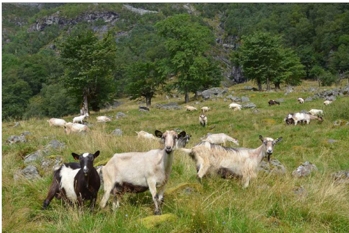
Figur 20. Geiter på beite i tilknytning til haustingsskog i Jølster, Sogn og Fjordane.

Lauvoppslag og «problemartar» som ikkje blir beita eller som veks kraftig og er vanskelege å halde nede (t.d. brennesle, mjødurt og bringebær), må ein rydde manuelt og gjerne fleire gonger per sesong dei fyrste åra.