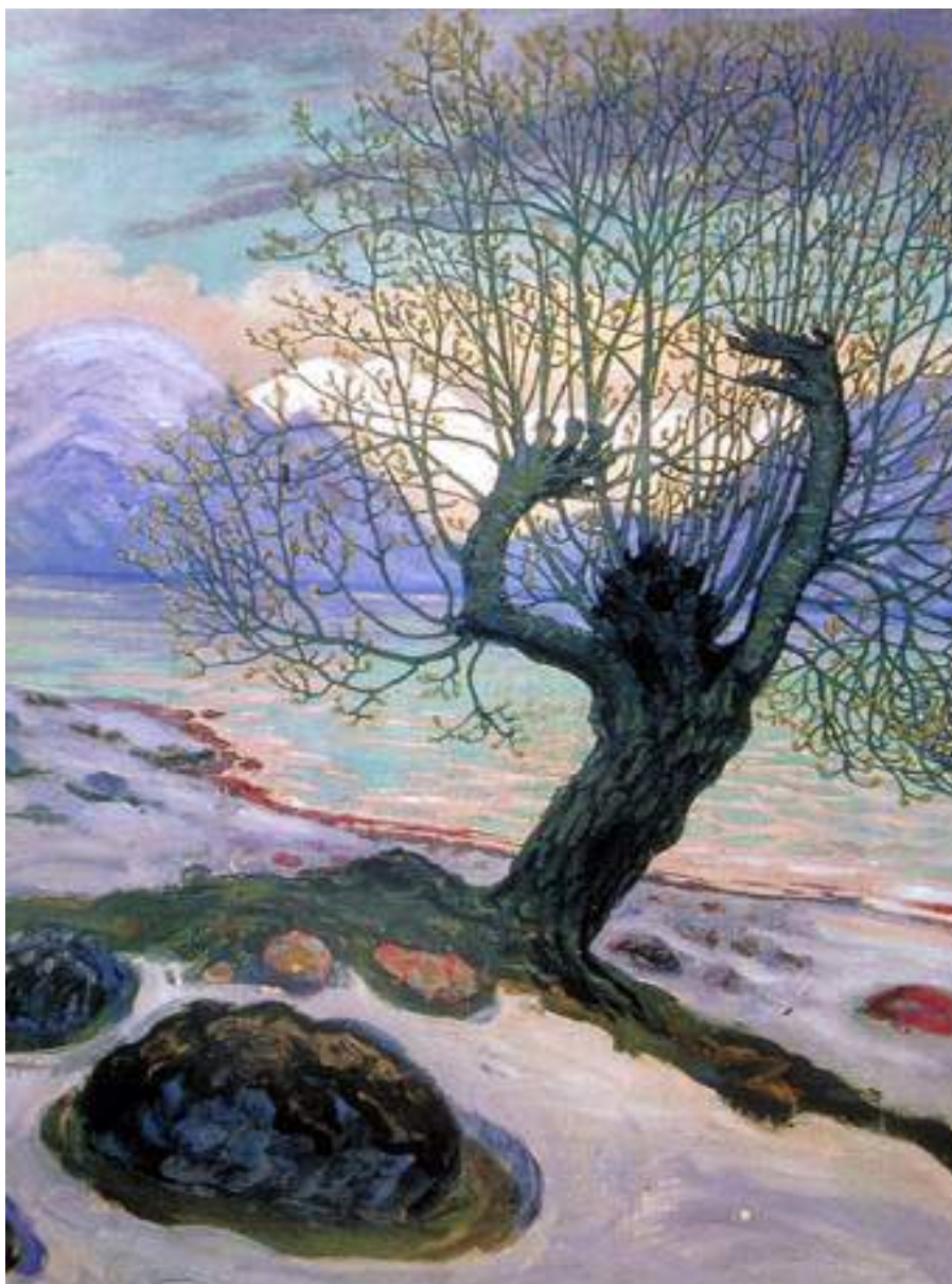
Figur 1. «Marzmorgen»/«Seljekall» av Nikolai Astrup. Den spesielle biologien gjev styvingstrea den særegne utsjånaden, med tjukke «kroppar», krokete «armar» og små, tette kroner. Formene har gjeve assosiasjonar på fleire hald opp gjennom tidene, både i folkeeventyra og i kunsten.

I tillegg til å vera ein viktig del av kulturarven vår, ber haustingsskogen på eit rikt biologisk mangfald knytt til gamle tre. Sist, men ikkje minst, har lauvtre som har blitt hausta over generasjonar fått noko eventyraktig over seg. Det er ikkje mange stader natur- og kulturarven går så hand i hand som nettopp i haustingsskogen!