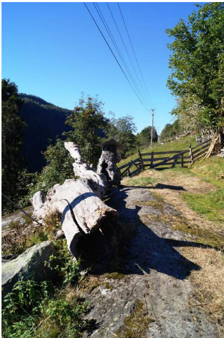
Figur 18. Gamle stammerestar som er spart og lagt i nærleiken av dei levande styvingstrea i lauvingslia på Myljom-To i Hjartdal, Telemark. Dei er flotte å sjå på, og er i tillegg «artshotell» for artar knytt til gamal og daut ved, til dømes mange sjeldne lavartar.