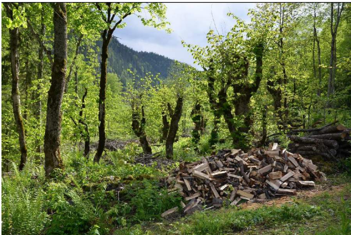
Figur 17. Restaurering av haustingsskog av alm på Ambjørndalen, Hjartdal kommune i Telemark. Ein starta i jordekantar der det var lysope og utvida etter kvart. Det er mykje arbeid med ved og kvist. Kvisthaugar kan ikkje brennast nær trea.