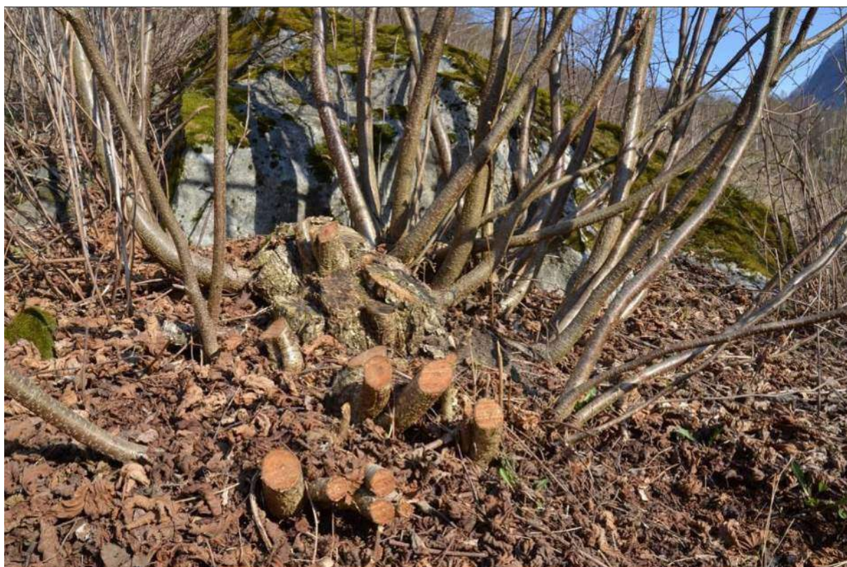
Figur 11. Uthogging av hasselstakar. Dei gamle stubbane og røtene kan blir sær gamle.

Verdien av lauvtre som fôrressurs kjem godt fram i ulike historiske samanhengar, mellom anna ved verdsetjing av eigedomar og i samband med arv. Det finst mange konkrete døme på at styvingstre og lauvingsrettar blei omsette for seg sjølve, uavhengig av grunneigedomen elles. Alm var særleg verdsett i slike samanhengar, både på grunn av fôrverdien og almeborken, som kunne nyttast til matmjøl i uår og «borkebrødstider».