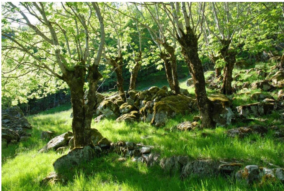
Figur 4. Hagemark med styvingstre av ask i Mogleiv, Suldal kommune, Rogaland. Det er steinete, men nok beitemark til at det reknast som hagemark og ikkje haustingsskog.

Hagemark er ikkje definert som eigen naturtype i NiN, men er å finne som T*32 Semi-naturleg eng prega av beite (-BT), saman med skildring av tre- og busksjiktet med eventuell førekomst av styvingstre (-HT-ST) eller tre som er stubbelauva (-HT-SL).