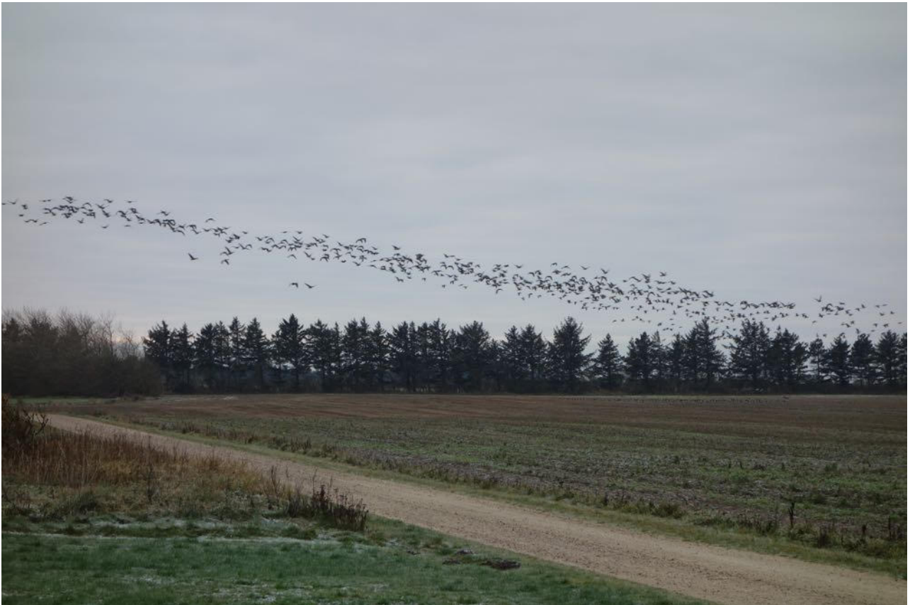
Fugle omkring Skjern Å, foto kb.

kan rekvireres ved mail til info@kulturlandskab.org