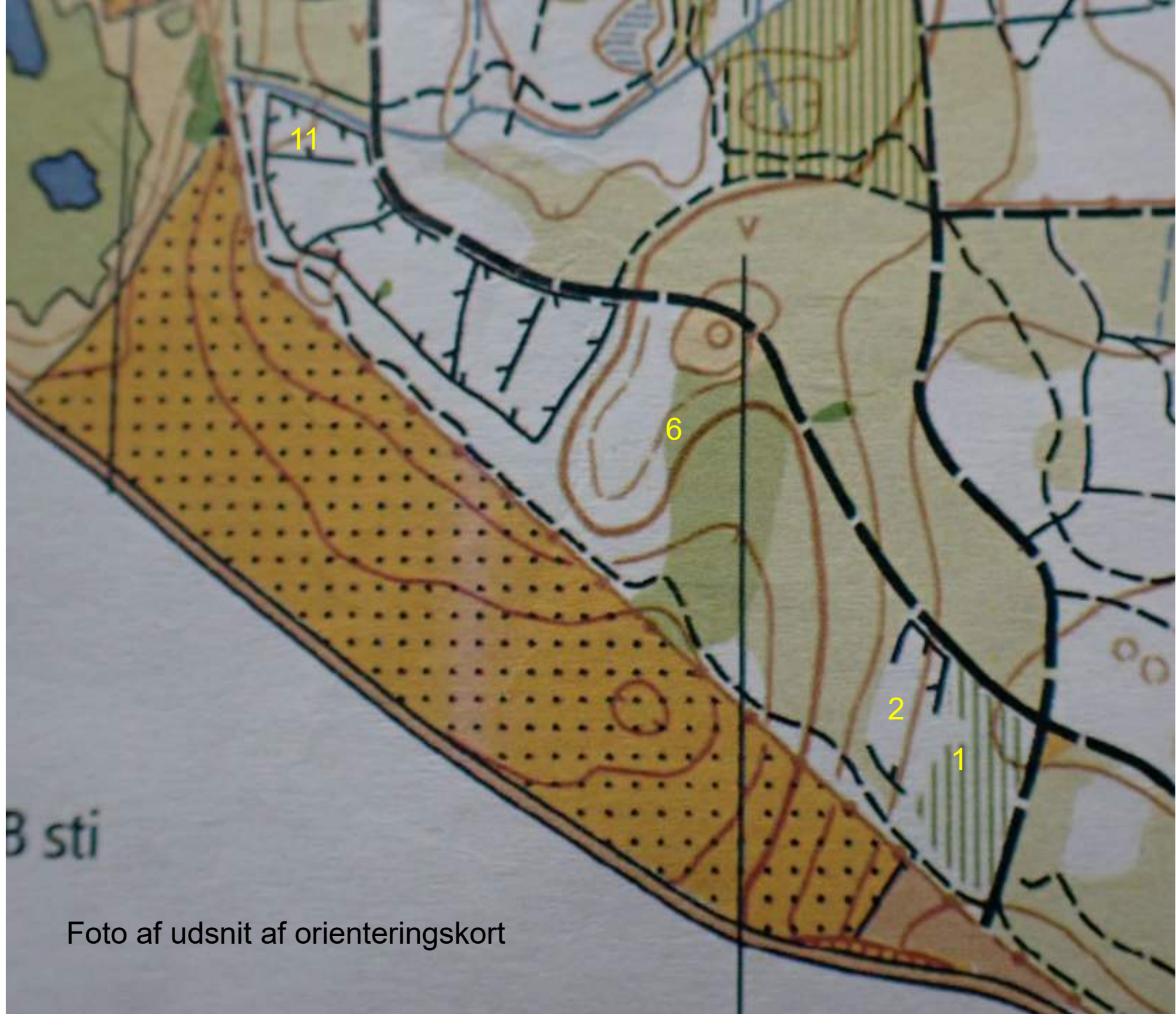
Foto af udsnit af orienteringskort