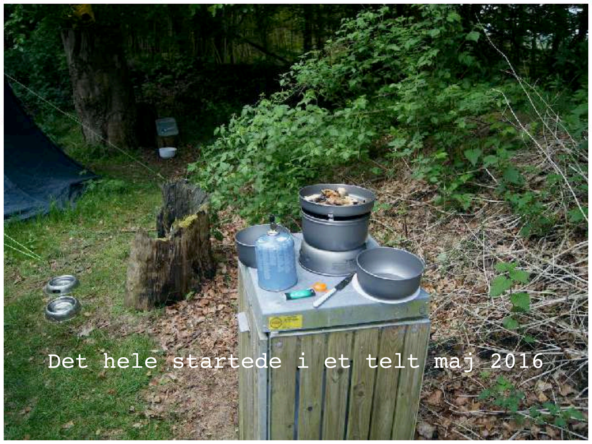
Det hele startede i et telt maj 2016