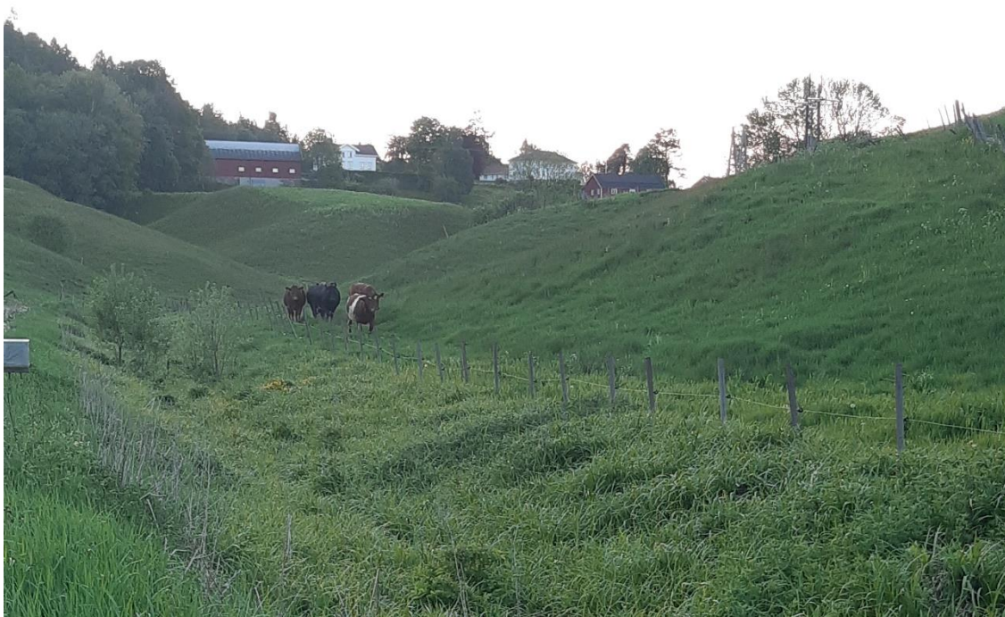
Kyr på beitemarker ved Solberggruva.