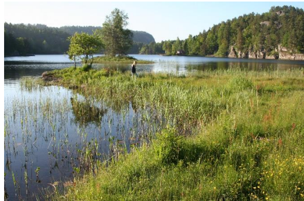
Fra Knutelia.