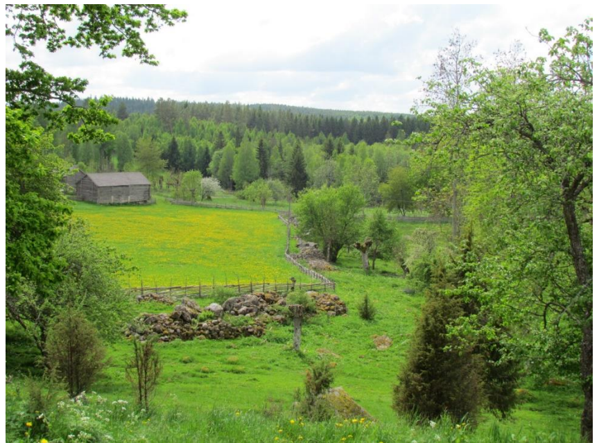
Kulturresevatet Smedstorps dubbelgård

Södra Östergötland är en småbruten och ganska kuperad skogs- och mellanbygd med många små välskötta gårdar, tillsammans med en del gods och säterier. Historiskt är det här en blandning av ensädes- och tresädestrakter, till skillnad från slättbygdernas tvåsädesbruk. Här finns flera mycket fina områden där många av de här kvaliteterna fortfarande hålls levande.